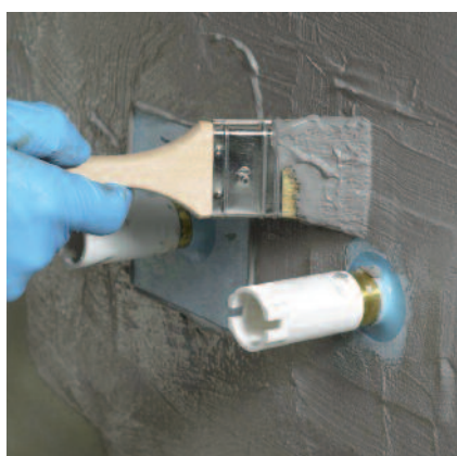
7) Aplikují se těsnicí manžety PCI Pécitape® 10x10.