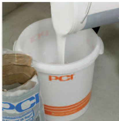
2) Tekutá složka PCI Seccoral® 2K Rapid se nalije do čisté nádoby.