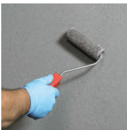
8) První vrstva se nanese např. válečkem celoplošně na podklad.