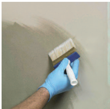
1) Podklad se navlhčí.