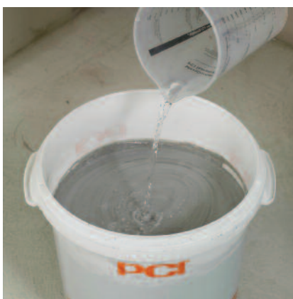
5) Pro aplikaci natíráním (1b) se přidá určené množství vody.