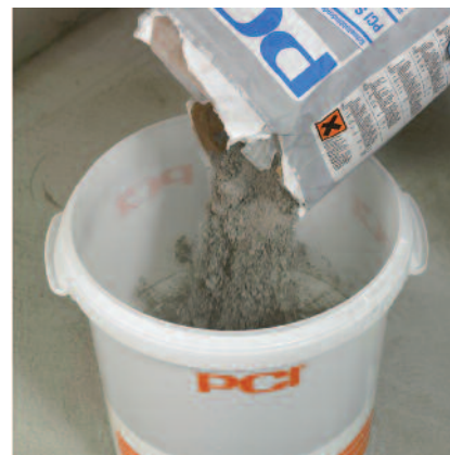
3) Následně se přidá prášková složka PCI Seccoral® 2K Rapid.