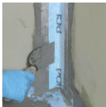
6) Hrany a rohy se utěsni izolační páskou PCI Pécitape® 120 nebo PCI Pécitape® Objekt.