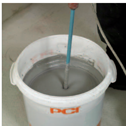
4) Pro aplikaci hladítkem (1a) rozmíchejte do homogenní směsi.